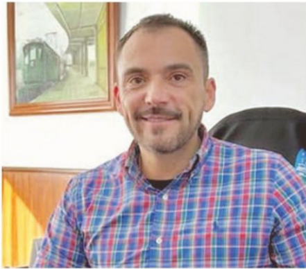
UN DURO ESCENARIO ESPERA AL ALCALDE DE LA CALERA.

El caso tiene su origen en un informe de la Contraloría General de la República, que detectó irregularidades en el uso de bienes fiscales. Según los antecedentes, máquinas destinadas a trabajos comunitarios habrían sido desviadas para realizar faenas en terrenos vinculados a la autoridad, lo que derivó en una sanción administrativa previa y, ahora, en la persecución