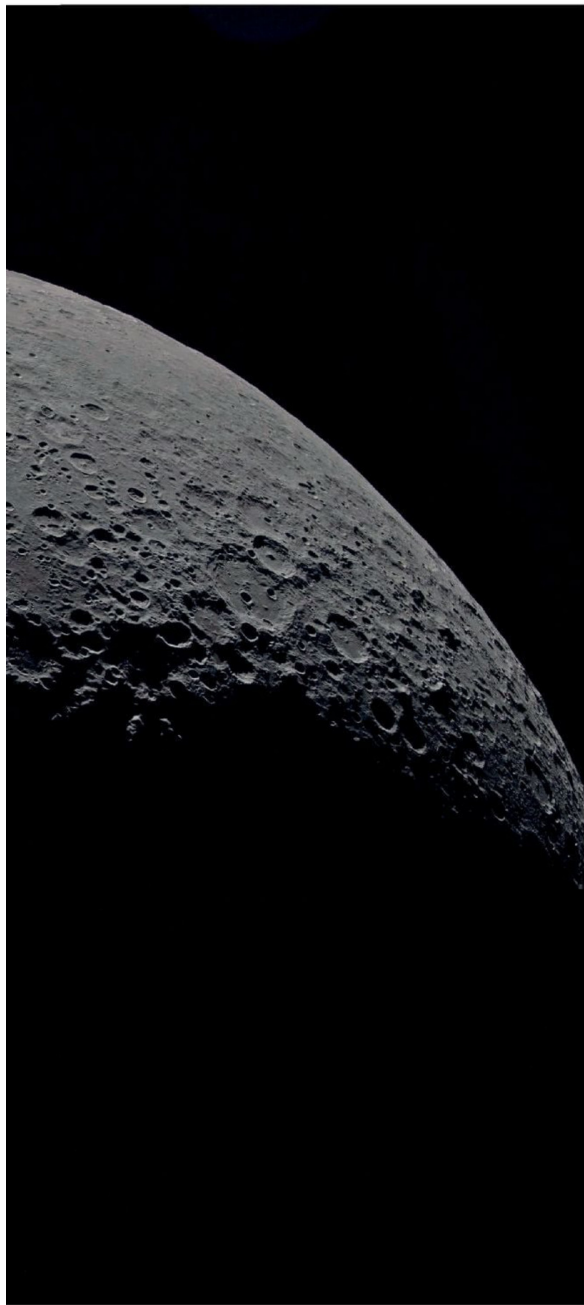
► Imagen de la Luna y la Tierra tomada por la misión Artemis.

busca "dar forma a una arquitectura de gobernanza en la Luna centrada en China". Con este fin, Beijing planea alunizar en 2030 y contar con una base operativa en 2035.