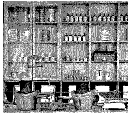
OCTAVIO CORNEJO CHACÓN (stand 25): Este actor dedicado desde hace dos décadas a las antigüedades y oficios patrimoniales chilenos, recreó un emporio de la década de 1930, a partir de muebles vitrinas rescatados (y restaurados) de un antiguo almacén ñuñoíno. Además, al interior de la casona presenta una colección de cámaras, telones de fondo pintados y caballitos de fotografías minuterios. @antiguedades_el_minutero.