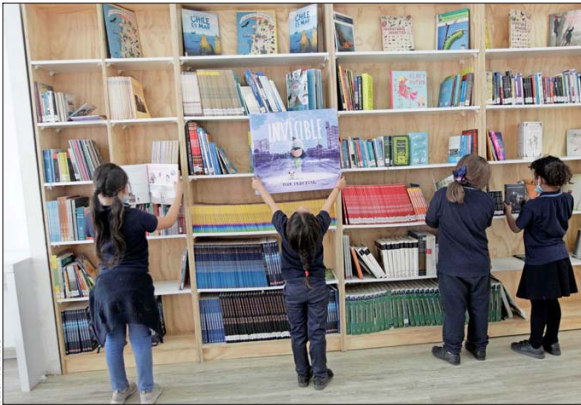
La biblioteca no es solo un espacio para sacar libros, sino también centro de muchas actividades de la comunidad. En la imagen, uno de estos espacios en el sector El Castillo de La Pintana.