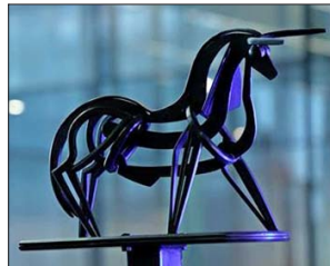
Diseñado por el artista Francisco Gazitúa, la escultura "El toro Fuerza TP", es el reconocimiento que reciben los ganadores, un símbolo de la fuerza, el trabajo y compromiso de los técnicos y profesionales que impulsan el desarrollo regional y productivo de Chile.