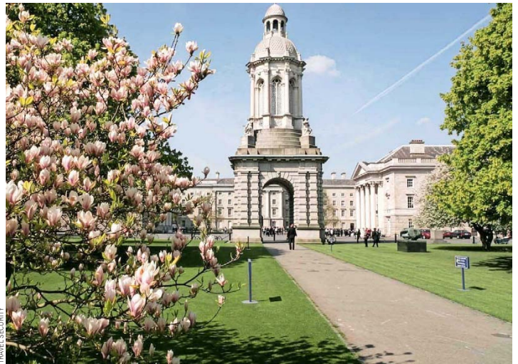
Trinity College de Dublin.

Desde Travel Security afirman que viajar con él es una experiencia cultural enriquecedora y única. Este Viaje de Colección recorre algunos de los paisajes más imponentes de Europa: los acantilados de Moher, las colinas del Connemara, los pueblos de piedra del Ring of