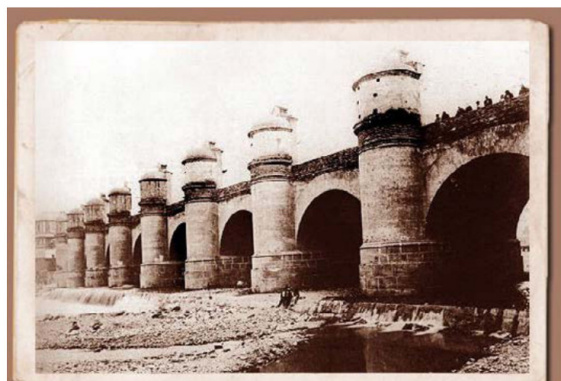
Doscientos mil huevos se emplearon para construir el histórico puente.