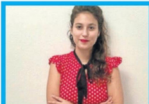
Cristina Bravo Seremi de Trabajo y Previsión Social (Partido Republicano)

● No ha sido nombrado y varias figuras al interior del oficialismo dicen que esta es una de las carteras en disputa de mayor competencia. Se desconoce si podría quedar en manos de Republicanos, de la UDI, Renovación Nacional u otro partido.