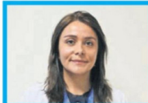
Silvana Flores Seremi de Salud (Partido Republicano)

● Ingeniera civil industrial e ingeniera en computación e informática, asumió como seremi de Obras Públicas en Atacama. Cuenta con un magíster en Dirección de Empresas y más de 20 años de experiencia profesional, con foco en planificación estratégica, gestión de inversiones públicas y desarrollo regional.