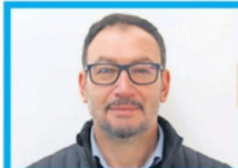
Guillermo Procuriza Seremi de Agricultura (Unión Demócrata Independiente)

● Arquitecto y magíster en diseño arquitectónico con mención en eficiencia energética. Conocido en la región, inició su trayectoria política como CORE y fue candidato a alcalde de Copiapó en dos ocasiones y a diputado, sin resultar electo. También su designación ha sido vista como un premio de consuelo.