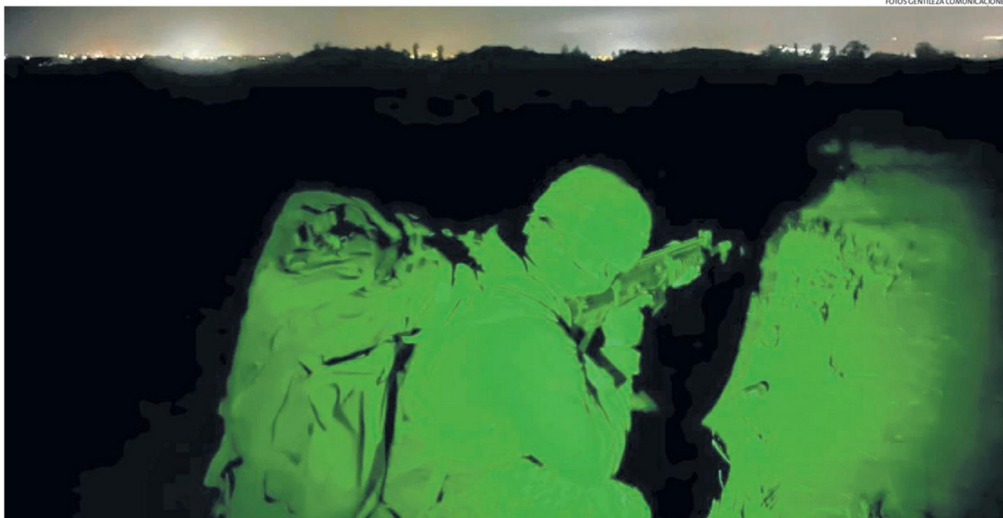
LOS INTEGRANTES DE LA BRIGADA REALIZARON PRÁCTICAS CON VISORES NOCTURNOS, TIRO DE COMBATE, NAVEGACIÓN TERRESTRE, DESPLAZAMIENTOS TÁCTICOS Y TÉCNICAS DE COMBATE CERCANO. C