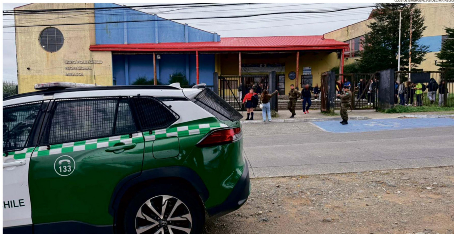
TRAS EL ÚLTIMO INCIDENTE EN EL LICEO POLITÉCNICO MIRASOL DE PUERTO MONTT, CARABINEROS LLEVÓ DETENIDO A CUATRO ADOLESCENTES ALUMNOS DEL ESTABLECIMIENTO.