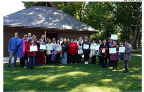
TREINTA FUERON LAS MUJERES CUIDADORAS BENEFICIADAS.