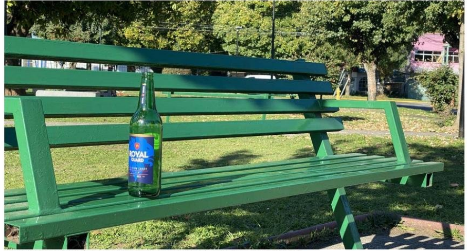
EN LAS MAÑANAS ES COMÚN VER BOTELLAS Y CAJAS DE VINO QUE QUEDAN DE LA NOCHE ANTERIOR.

en los últimos 3 años han entrado a robar a la sede social, ubicada a un costado de la plaza Ejército. Dirigentes se sienten cansados.