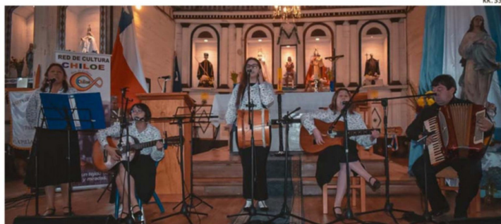
EL TEMPLO ES USADO EN ACTIVIDADES QUE ESCAPAN DE LO ESTRICTAMENTE RELIGIOSO, COMO MISAS Y DIVERSAS FIESTAS PATRONALES. ACOGIÓ EL ACTO PROVINCIAL DEL DÍA DE LOS PATRIMONIOS EL 2025.

Respecto a la próxima instalación de puntales, el CMN detalló que se contemplan medidas de protección para evitar el ingreso de humedad, como el sellado de juntas, aplicación de tratamientos en las superficies expuestas y en contacto con el suelo, y el uso de fijaciones metálicas (clavos y tornillos) que garantizan un comportamiento estructural unitario, verificado por un ingeniero calculista. ☺