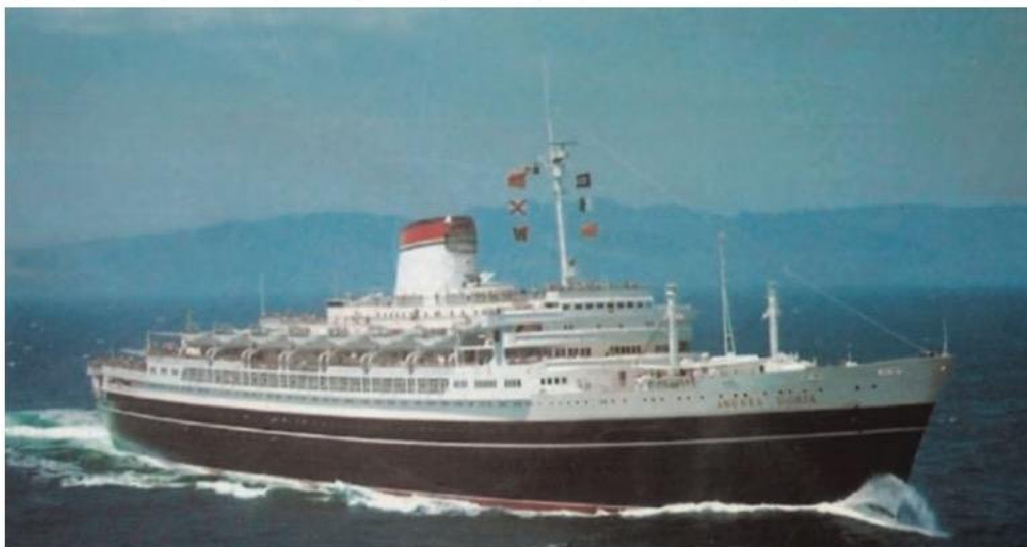
El transatlántico destacó por su lujo y avanzadas características técnicas, pero exhibía graves problemas de estabilidad lateral desde su viaje inaugural.

de 1951 y comenzó a operar el 14 de enero de 1953. Durante ese periodo, Italia buscaba recuperar el prestigio perdido durante el conflicto bélico, y el lan-