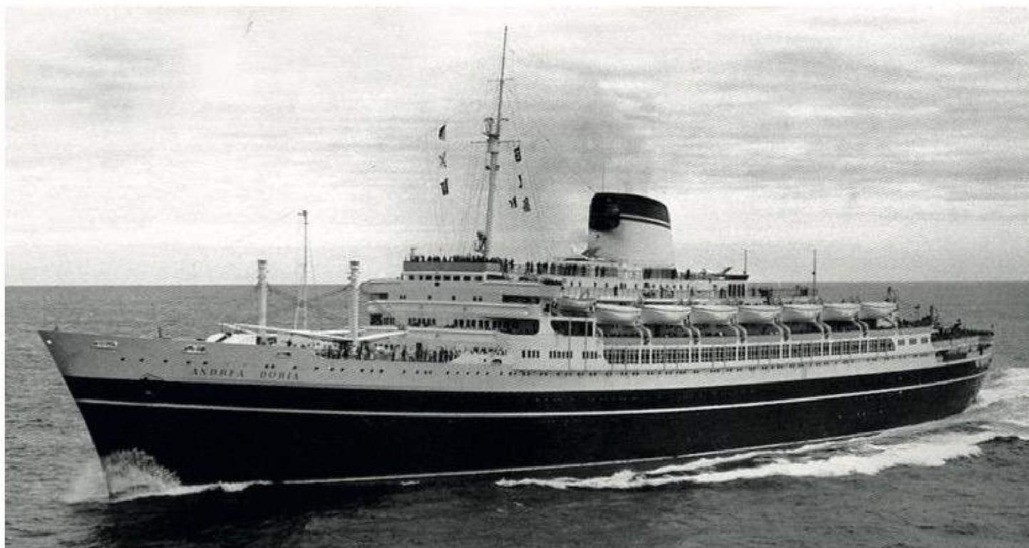
El naufragio del Andrea Doria en 1956 impulsó reformas en los protocolos de seguridad marítima internacional.