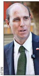
Martín Arrau, ministro de Obras Públicas.

El ministro de Obras Públicas, Martín Arrau, se trasladó hasta la localidad de Colchane, en la Región de Tarapacá, para supervisar en terreno los avances en la construcción de un conjunto de obras de infraestructura que tienen como objetivo mejorar la seguridad y el control migratorio en la frontera norte con Bolivia.