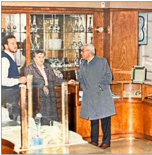
La tienda de Casa Barros en el Centro de Santiago.

El perfil tanto de compradores como de clientes es muy diverso, indican. Sin embargo, en los últimos años han visto crecer uno específico: la mujer que elige por criterio propio. "Tiene entre 30 y 60 años, una trayectoria construida, y cuando entra a Casa Barros no está buscando que le regalen algo. Está eligiendo una pieza que la represente. No necesita que nadie se la justifique ni se la compre. Eso ha cambiado bastante la forma en que pensamos nuestra comunicación y nuestros eventos, porque es un público que sabe exactamente lo que quiere y aprecia cuando una marca lo trata como tal".