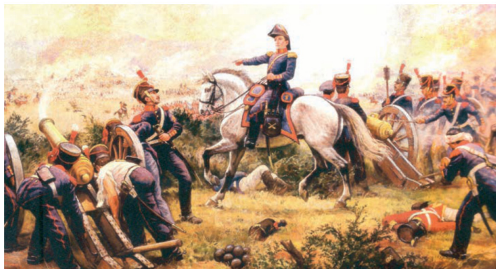
El coronel Borgoño dando instrucciones precisas a sus artilleros en la Batalla de Maipú. Sus disparos precisos fueron decisivos en el triunfo patriota.