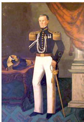
Retrato al óleo del General de división Domingo Urrutia Vivanco. Colección del Museo Histórico Nacional.

D urante la Guerra de Independencia, el territorio maulino fue escenario de escaramuzas, enfrentamientos, combates y batallas entre patriotas y realistas. Con el paso del tiempo, las hazañas de los soldados de uno y otro bando se narraban alrededor de una fogata en las zonas campesinas, o bajo un alero de vigas de roble en villas y pueblos, para que su heroísmo no desapareciera del todo, ni quedase relegado exclusivamente a algunos libros. Así, cada cierto tiempo algunas comunas de la región, como Yerbas Buenas, Talca, Linares, Curicó, Quechereguas, Cauquenes, Villa alegre, San Javier, Cumpeo y otras, rememoran sucesos de ese período histórico. He aquí la semblanza de 3 soldados cuyos nombres están ligados a Talca y al Maule.