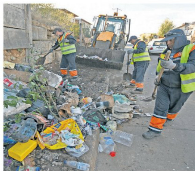
EL PROBLEMA PERSISTE PESE AL TRABAJO DEL EQUIPO DE ASEO.

Si bien se trata de un complemento a otras medidas dirigidas a mantener limpia la ciudad, expresa el alcalde de Te-