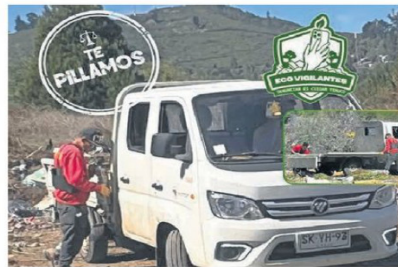
LA CIUDADANÍA COLABORA PARA DISUADIR A LOS INFRACTORES.

Bajo esta premisa, confiesa el alcalde, como equipo están muy conformes porque hoy ven a una ciudadanía empoderada que ha salido a defender su propio barrio, "gracias a la ayuda directa de los vecinos, quienes actúan como nuestros ojos en el territorio, nuestros fiscalizadores han podido recopilar antecedentes sólidos para (que quienes cometen estas faltas) sean entregados a los juzgados de Policía Local. Esta colaboración ha permitido que quienes insisten en ensuciar Temuco enfrenten las sanciones que corresponden. Porque cuando un vecino denuncia y cuida su espacio público, nos ayuda a demostrar que recuperar la calidad de vida en nuestra capital regional es una meta que solo alcanza-