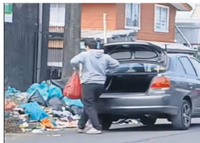
ESTO ES MALA EDUCACIÓN Y FALTA DE RESPETO FRENTE A LO AJENO.