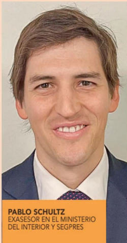
PABLO SCHULTZ EXASESOR EN EL MINISTERIO DEL INTERIOR Y SEGPRES