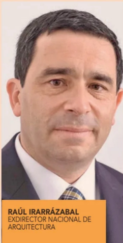
RAÚL IRARRÁZABAL EXDIRECTOR NACIONAL DE ARQUITECTURA