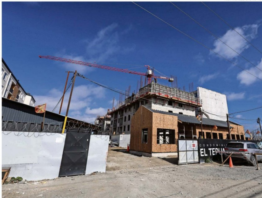
COMO LAS TORRES DE DEPARTAMENTOS TENDRÁN SIETE PISOS, LA NORMATIVA HACE EXIGIBLE QUE CADA UNA DE ELLAS CUENTE CON ASCENSORES.