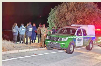
La fiscalía y el OS9 de Carabineros quedaron a cargo del caso, en la cuestra Zapata.

Seis cuerpos fueron recuperados desde la cuestra Barriga en abril del año pasado. El hecho marcó el inicio del frecuente abandono de víctimas de homicidio en esa zona, en el marco del crimen organizado.