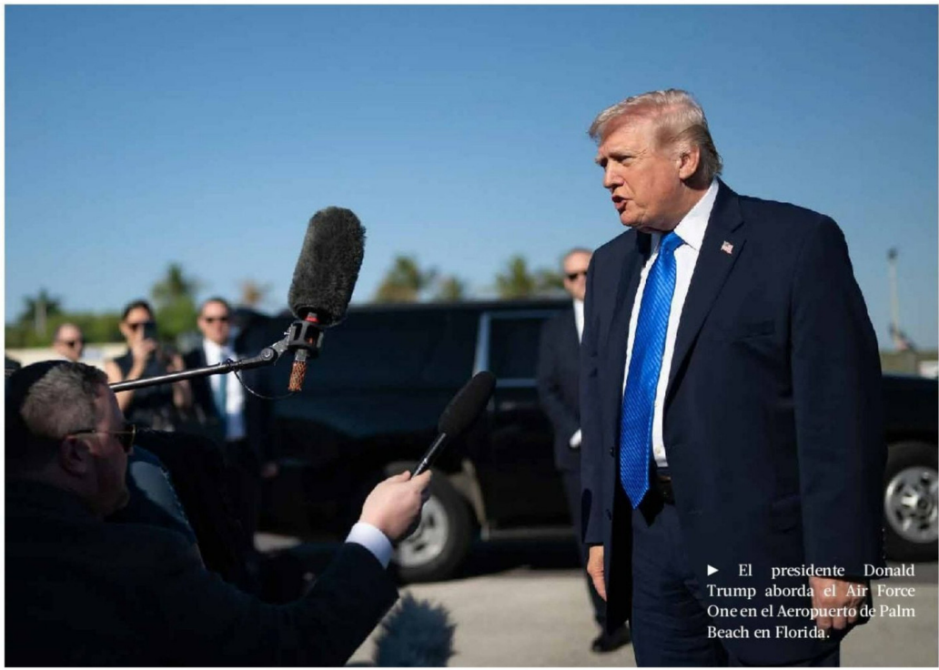
► El presidente Donald Trump aborda el Air Force One en el Aeropuerto de Palm Beach en Florida.

La agencia británica de Operaciones de Comercio Marítimo (UKMTO) informó este lunes que se estaban aplicando restricciones de acceso marítimo que afectan a los puertos y zonas costeras iraníes, incluyendo ubicaciones a lo largo del golfo Pérsico, el golfo de Omán y el estrecho de Ormuz. “Las restricciones de acceso se aplican sin distinción a los buques de