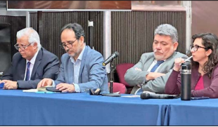
Los parlamentarios de oposición alertaron sobre el mayor costo para las familias que han tenido por las alzas de los combustibles.

Mientras el Gobierno se apronta al diálogo, las pymes alertan sobre los costos del reajuste salarial en el empleo formal.