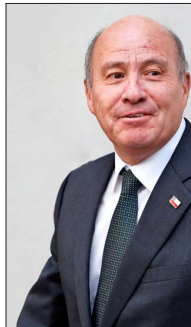
El ministro de Hacienda, Jorge Quiroz, enfatizó que la rebaja tributaria apunta a reactivar la economía.

Los principales contenidos del proyecto de ley de reconstrucción se conocerán mañana cuando el Presidente José Antonio Kast... En los días previos, el debate de la iniciativa, especialmente por su componente de rebajas tributarias, se ha crispado entre el Gobierno y la oposición.