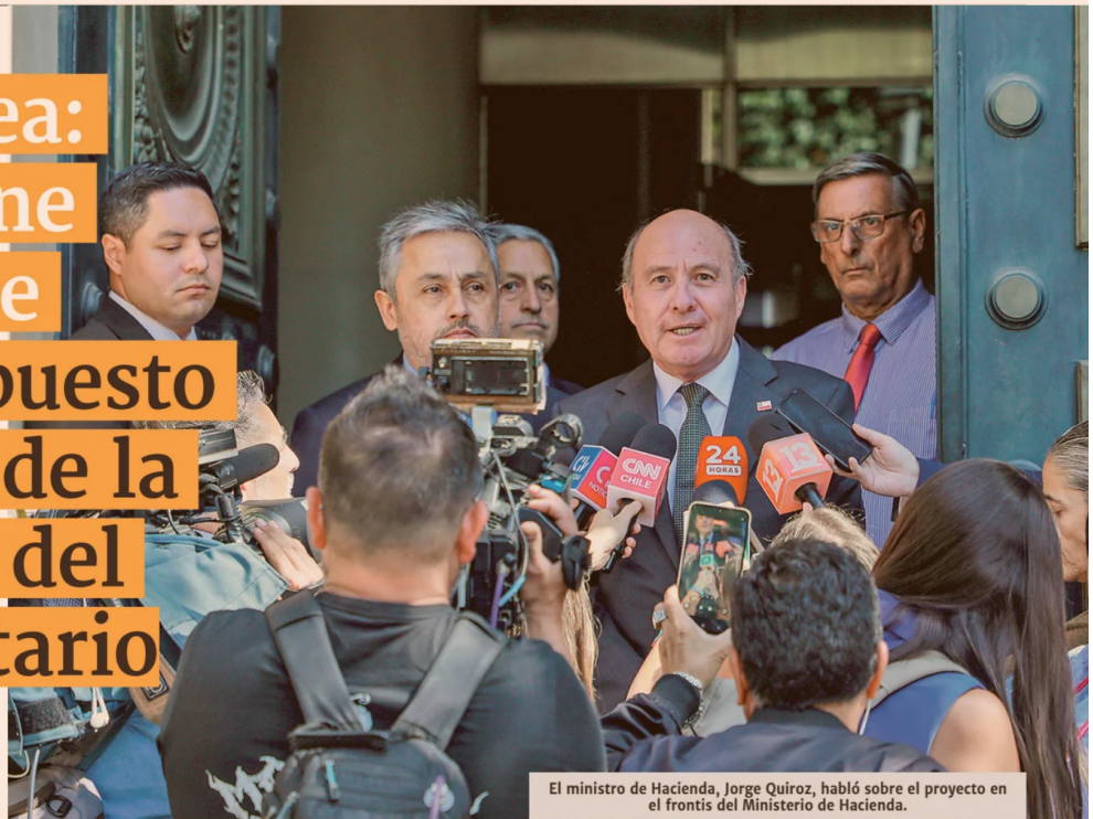
El ministro de Hacienda, Jorge Quiroz, habló sobre el proyecto en el frontis del Ministerio de Hacienda.

■ Hacienda también analiza una fórmula para que contribuyentes puedan retirar el saldo del FUT acumulado, para incentivar la inversión y aumentar la recaudación.