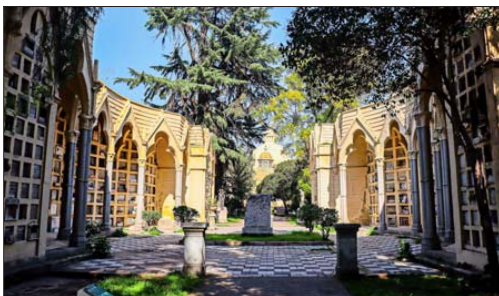
Capilla gótica y cenotafio de Bernardo O’Higgins en el Cementerio General, parte del casco histórico.

formativos, se mejoren los accesos y la iluminación, además de avanzar en la accesibilidad universal.