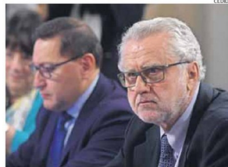
EL PRESIDENTE DEL DIRECTORIO DE CODELCO, MÁXIMO PACHECO.

naria de accionistas del próximo lunes 20 de abril, donde participarán los ministros Daniel Mas y Jorge Quiroz, de Hacienda, en representación del Presidente José Antonio Kast. "Las preocupaciones, consultas y dudas las voy a responder ahí, porque es lo que corresponde", afirmó, enfatizando su responsabilidad institucional al frente de la mayor productora de cobre del mundo.