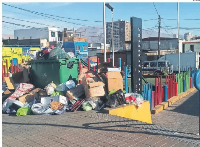
Basura que se genera en el sector de la CESFAM Guzmán tras la instalación de “coleros”.

Desde la municipalidad de Iquique explicaron que tanto el sábado como el domingo, efectúan retiro de la basura que dejan los “coleros”, tanto el sábado como el domingo. “Ahora bien, respecto de los “coleros” que se instalan entorno a la Feria Itinerante los días sábados y domingos,