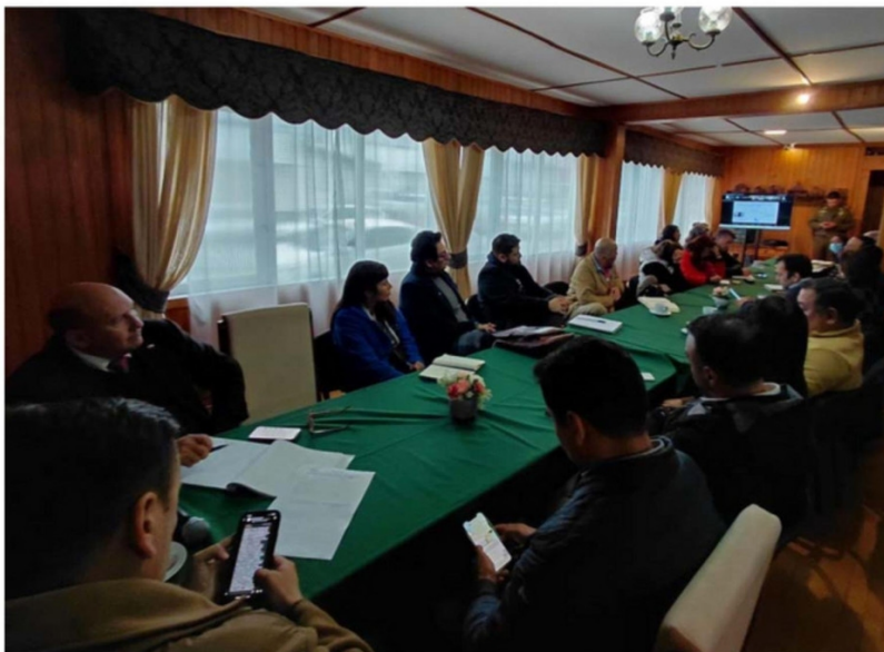
REUNIÓN CONVOCADA POR CARABINEROS CON DIRECTIVOS DE PLANTELES DE CASTRO.