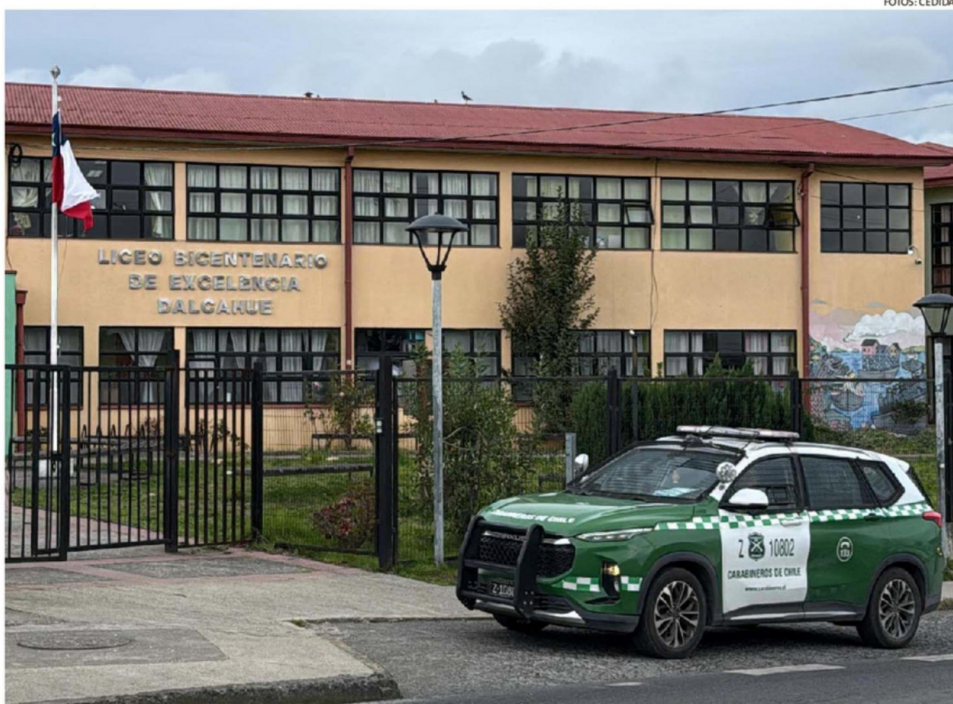
CARABINEROS DE LA TENENCIA DE DALCAHUE SE CONSTITUYERON EN EL LICEO BICENTENARIO DE LA COMUNA TRAS LA DENUNCIA.