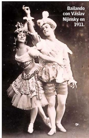
Bailando con Vaslav Nijinsky en 1911.

3. Recorrió con gran éxito numerosos países junto a su compañía de ballet , incluyendo versiones abreviadas de "Giselle" o "La flauta mágica". Entre sus destinos figuran Estados Unidos, donde hizo amistad con Charles Chaplin y filmó la película "The dumb girl of Portici", dirigida por Lois Weber, para los estudios Universal que se estrenó en 1916, en la imagen un afiche de la producción. También estuvo en México, India, China, Japón, Australia, Nueva Zelanda, Chile, Argentina, Brasil, Cuba y, por supuesto, Gran Bretaña, donde en 1909 bailó para los entonces reyes Eduardo VII y Alejandra. En 1912 compró Ivy House en Golders Green, en el distrito de Barnet, en Londres. Su jardín era conocido porque allí tenía un estanque con cisnes como mascotas, entre ellos Jack, su favorito, con el que incluso se fotografió. La casa, que también funcionó como una pequeña escuela de ballet , donde además guardaba algunas coreografías y parte de su vestuario, se convirtió después en sede del Centro Cultural Judío de Londres y posteriormente se transformó en la escuela King Alfred School. Una placa azul recuerda que ese fue el hogar de Anna Pavlova entre 1912 y 1931.