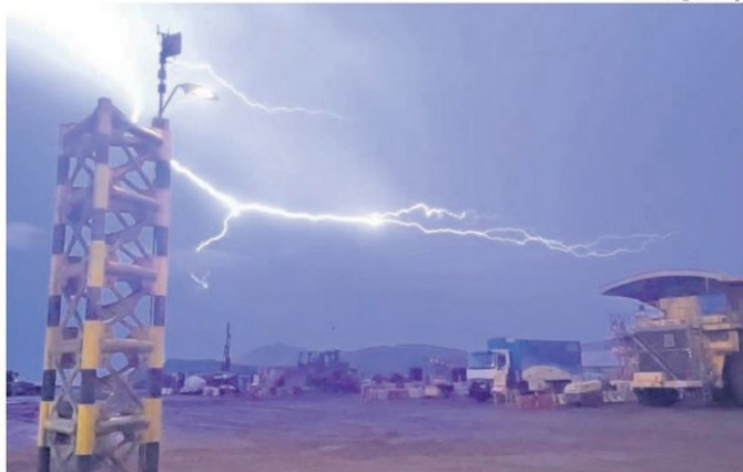
REGISTRO DE ESTRUENDO EN EL CIELO EN LA MINA CERRO NEGRO NORTE EN LA COMUNA DE COPIAPÓ.