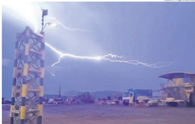
REGISTRO DE ESTRUENDO EN EL CIELO EN LA MINA CERRO NEGRO NORTE EN LA COMUNA DE COPIAPÓ.