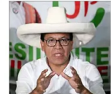
Postulante de izquierda usa el mismo sombrero del encarcelado exgobernante.