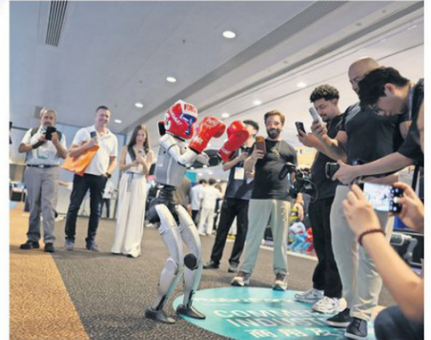
Humanoides hasta boxearon con los visitantes de la feria.