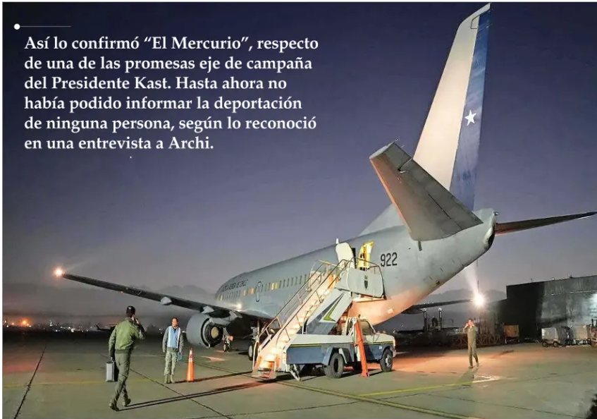
Vuelo de la FACH con extranjeros expulsados en octubre de 2025.

Así lo confirmó "El Mercurio", respecto de una de las promesas eje de campaña del Presidente Kast. Hasta ahora no había podido informar la deportación de ninguna persona, según lo reconoció en una entrevista a Archi.