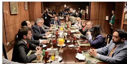
El encuentro entre la bancada PPD-Ind. y el Ejecutivo se había fijado el lunes pasado.

Soto, sobre el tema, señaló que "el Gobierno se abrió a la posibilidad de compensar a los municipios a través del fondo común municipal, respecto de su propuesta de eliminar las contribuciones para la primera vivienda en el caso de adultos mayores. Estamos a la espera