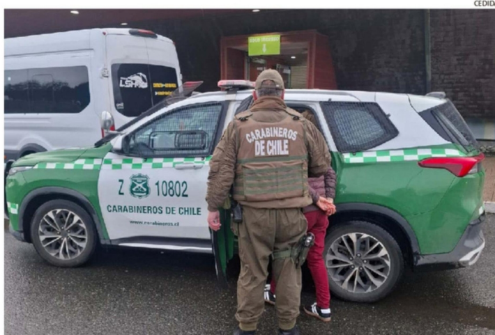
ISLEÑA DE 66 AÑOS FUE DETENIDA POR CARABINEROS Y HOY SERÁ PUESTA A DISPOSICIÓN DE TRIBUNAL

nal", como también el respectivo denuncia a Carabineros de Chile.