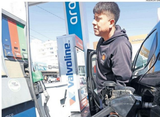
EL ALZA DE LOS COMBUSTIBLES FUE UN FACTOR QUE GATILLÓ EN EL ALZA DEL COSTO DE LA VIDA.

ponde a la implementación de descuentos en combustibles, a través de un convenio que permitirá rebajas por litro en gasolina, diésel y parafina. Los montos varían según el día de la semana, incluyendo descuentos aplicables durante jornadas específicas, además de un beneficio adicional vigente hasta fin de mes.