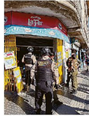
OPERATIVOS EN LA REGIÓN.