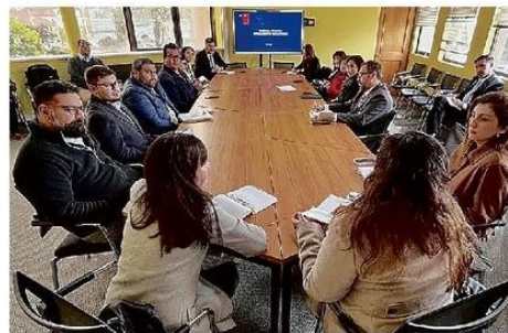
LA MESA DE SEGURIDAD SE REALIZÓ EN LA DELEGACIÓN PROVINCIAL.

Ayer en la delegación presidencial provincial, se realizó una mesa de seguridad escolar, que contó