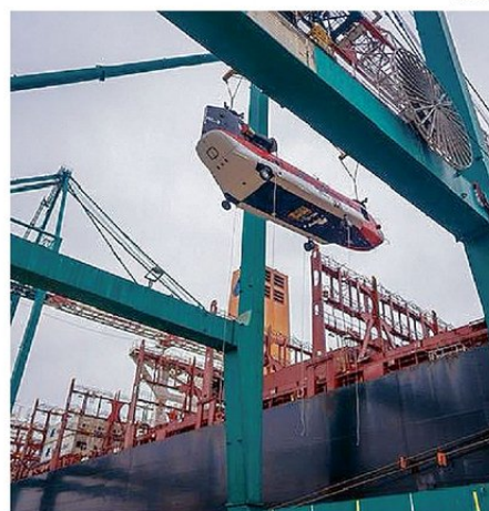
LA DESCARGA Y EMBARQUE REQUIEREN MANIOBRAS DE CUIDADO.

mundialmente por su capacidad y eficiencia en el combate de incendios forestales, y aterrizaron en nuestro terminal a inicios de este año. Su llegada marca un importante refuerzo a la estrategia nacional de prevención y