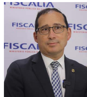
El fiscal regional de O'Higgins, Aquiles Cubillos reveló que ha recibido alrededor de 180 denuncias vinculadas a amenazas en recintos educacionales.

En medio de la creciente tensión que atraviesan las comunidades educativas de la región, el fiscal regional de O'Higgins, Aquiles Cubillos, entregó un balance que pone cifras a la crisis de seguridad, desde que