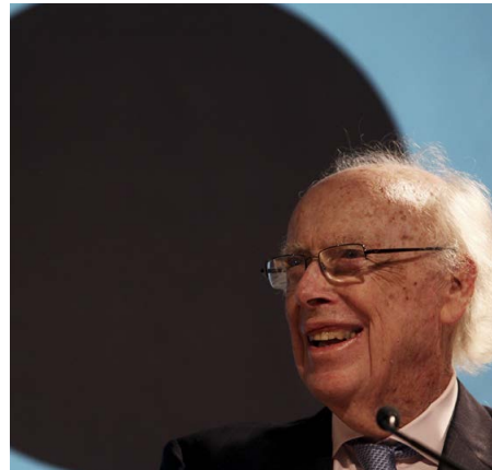
Imagen de archivo del premio nobel de medicina, James Watson, quien junto a Francis Crick descubrieron la estructura del ADN en 1953. 4.-Una doctora visualiza una molécula de ADN en una pantalla virtual.

Además es determinante en las pruebas de paternidad