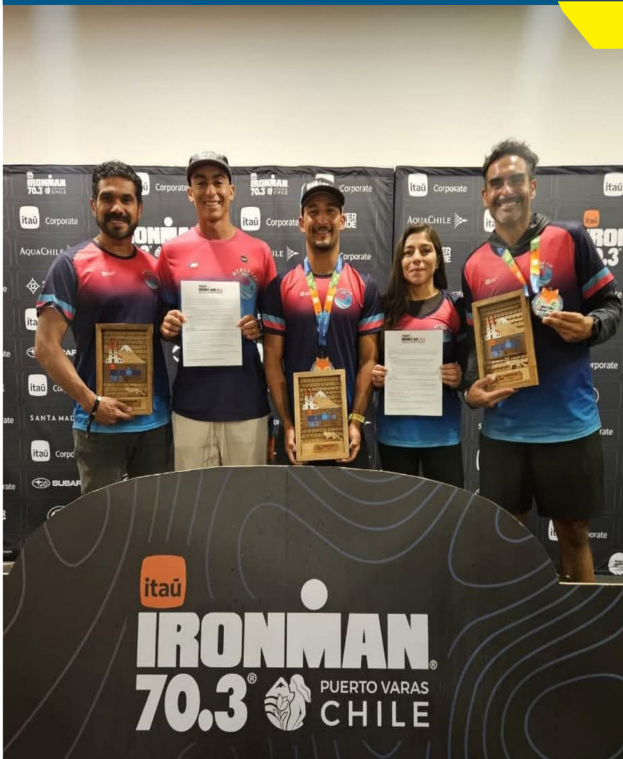
Destacada actuación en el Iron Man de Puerto Varas tuvieron triatletas iquiqueños.