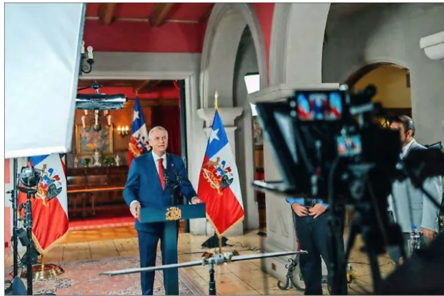
El Presidente José Antonio Kast, durante la grabación de la cadena nacional en Cerro Castillo.