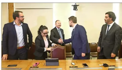
En un momento de la reunión, el PS optó por interrumpir el diálogo.

después de la reunión, la bancada del Frente Amplio emplazó al ministro García Ruminot a sostener una reunión, considerando que ha privilegiado las conversaciones con los sectores “más al centro” de la oposición, especialmente el PPD y la DC. El FA, a su vez, presentó un documento con medidas a tomar en cuenta para el proyecto, lo que incluye la creación de una mesa que se pronunciará sobre las partes de la iniciativa susceptibles de prosperar.