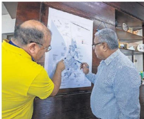
EL ALCALDE REVISANDO SECTORES EN DONDE HABRÁ MEJORAS.

Asimismo, se incluyen proyectos específicos de alumbrado público con integración de cámaras en sectores como Tierras Blancas, Barrio Chinchorro, Ampliación Chile II y Borde Pampa, reforzando la prevención del delito en puntos estratégicos.