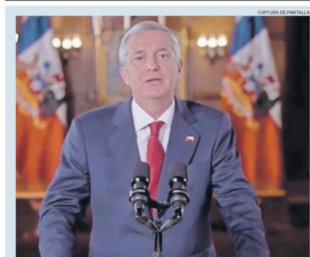
CAPTURA DE PANTALLA

El asunto fue corroborado por concejales, mientras el Municipio apuntó que los requerimientos de bomberos han bajado en los últimos meses. Pág. 3