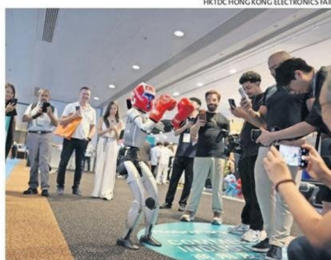
HUMANOIDES HASTA BOXEARON CON LOS VISITANTES DE LA FERIA.

En el evento que comenzó este lunes algunos expositores mostraron capacidades robóticas desde hablar con humanos, golpear y hacer arte con arena, hasta dar volteretas hacia atrás y atrapar a una persona con