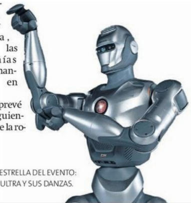
LA ESTRELLA DEL EVENTO: X2 ULTRA Y SUS DANZAS.