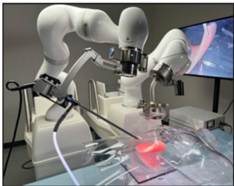
Robot quirúrgico asistido por imanes permitirá realizar cirugías abdominales con menos incisiones, reduciendo el dolor y los tiempos de recuperación en los pacientes.