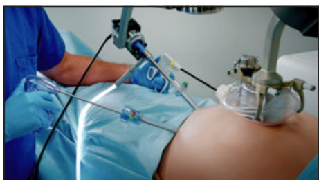
La tecnología será implementada en el Hospital San Camilo, convirtiéndose en el primer hospital público fuera de Santiago en