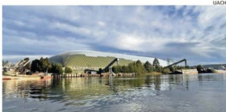
El domo se camufla en el entorno para no interrumpir el paisaje.

tructura en un elemento que se integra armónicamente al ecosistema fluvial y urbano.