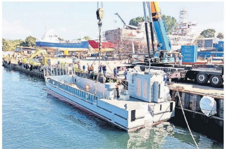
Lanzamiento al agua de la primera barcaza del Proyecto Escotillón IV

Actualmente, la empresa estatal impulsa uno de sus proyectos más relevantes de las últimas décadas: el Proyecto Escotillón IV, iniciativa que se enmarca en el proceso de renovación de la flota de la Armada de Chile y el aumento de su capacidad logística y operativa. El programa considera la construcción de cuatro buques multipropósito, destinados a apoyar operaciones de transporte de carga, vehículos pesados y equipamiento, además de su empleo en misiones