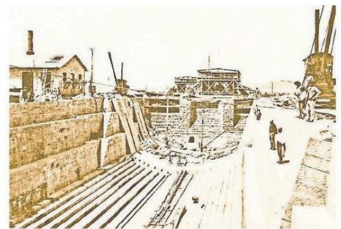
Obras de construcción del Dique Seco N°1 en Talcahuano, 1888

en la industria naval chilena, fortaleciendo las capacidades operativas de la Armada de Chile desde la Región del Biobío.